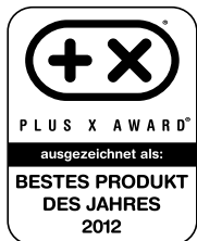
PLUS X AWARD 2012 Bestes Produkt des Jahres