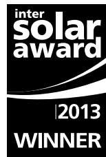
Intersolar AWARD 2013 Solar Projects in Europe