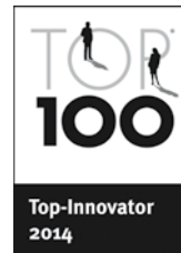
Deutscher Mittelstands-Summit 2014 TOP 100 Top-Innovator