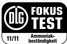
DLG Fokus Test 2011 Ammoniakbeständigkeit

Sie eignet sich nicht nur für private Haushalte, sondern auch für die Anbringung auf Firmenparkplätzen, Gaststätten und Gewerbebereichen, wie zum Beispiel an Einkaufszentren oder an öffentlichen Parkplätzen.